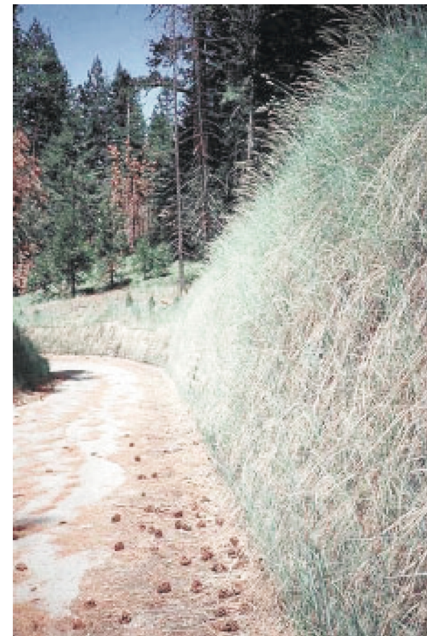
Готовое решение - зеленая подпорная стенка GEOWEB