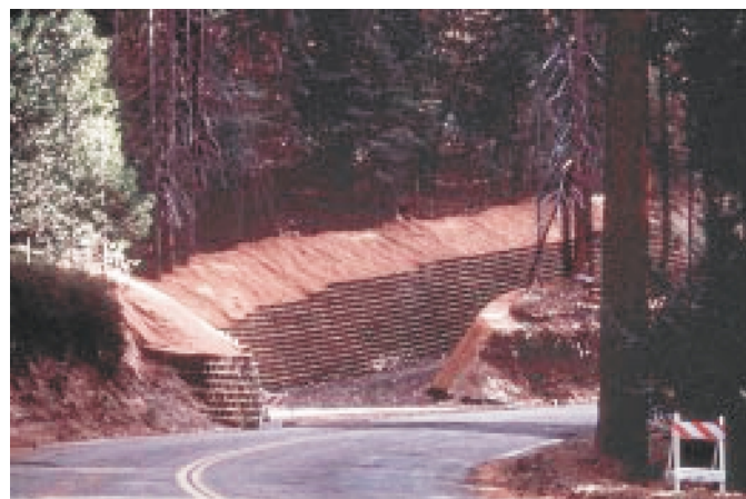
Вид готовой подпорной стены GEOWEB до гидропосева травы